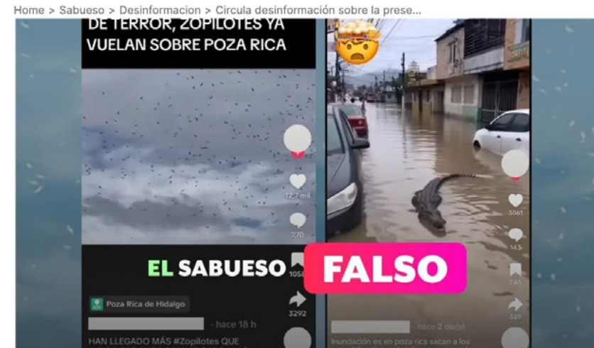
Capturas de pantalla de las publicaciones que desinforman sobre la presencia de animales en Veracruz

En Facebook y TikTok circularon videos, sin sustento científico, de un conferencista que aseguró que el volcán Popocatepetl pronto hará erupción y que en México se acerca un “gran terremoto”. Además, un video en TikTok y Facebook publicado tras las inundaciones en Poza Rica, Veracruz, afirmó que hubo avistamientos de cocodrilos y de zopilotes sobrevolando las zonas afectadas en busca de alimento. Sin embargo, se trató de una desinformación que se sumó a la circulación de una serie de contenidos falsos en torno a las torrenciales lluvias en el estado.